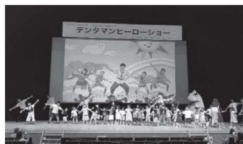
はっけよいアニマル体操の様子

6月16日(日)日進市において、愛豊歯科医師会主催のイベント(デンタマンヒーローショー)では当支部による「どっちかな?クイズ」「はっけよいアニマル体操」を行った。初の試みであったが盛況であった。