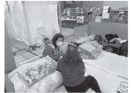
避難所でのアセスメントの様子

※JDAT=Japan Dental Alliance Team：日本災害歯科支援チーム