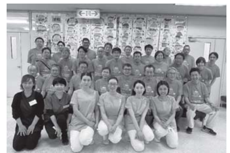
スタッフ集合写真

6月6日(木)港保健センターで0歳~小学生までの親子を対象とした「歯と口の1日健康センター」が行われた。来場者数は58名であった。当支部は区の歯科医師による健診・フッ化物塗布の補助を行った。名古屋市歯科医師会附属歯科衛生士専門学校の学生による講話もあり、充実した内容で賑やかなイベントとなった。