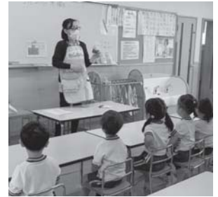
園児へのエプロンシアターの様子

5月30日に海部歯科医師会主催の前期歯の健康センターが飛島保育園で開催された。当支部からは1名が参加し、2クラスの園児に媒体を使い健康教育を行った。楽しく聞き入っている園児の姿がとても印象的だった。幼児期からのむし歯予防の大切さを啓発するよい機会となった。