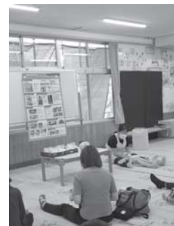
親子ピカピカ教室の様子