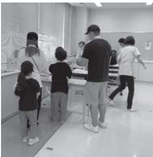
健診を受ける家族

小さい頃より、かかりつけ歯科医院をもち、我が子の歯や口の健康を守りたいと強く望む保護者が多く、ブラッシング指導や健康相談で熱心に聞く姿が目立った。今後も会場に来場するメリットを感じていただけるよう情報発信し、子育て中の保護者への支援となるよう盛り上げていきたい。