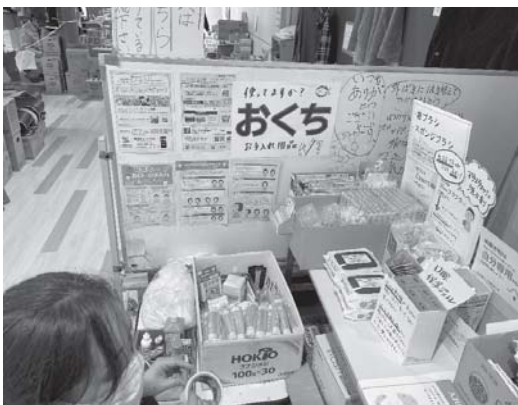
口腔ケア物品の配置や掲示の様子 様々な物資に埋もれてしまうため見やすく わかりやすい掲示を心掛けた