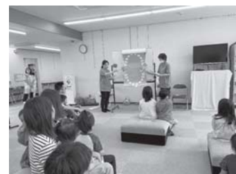
ペープサート(紙人形劇)の様子

6月2日(日)阿久比町保健センターにて、半田歯科医師会主催の歯と口の健康週間事業が開催された。当支部が主体となり3名の会員による幼児向けのペープサート(紙人形劇)を行った。今年もセンターを訪れた来場者77名が楽しそうに参加した。職員からも「やってもらえてよかった！」と好評だった。